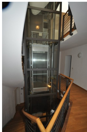
Fahrstuhl u. Hausflur