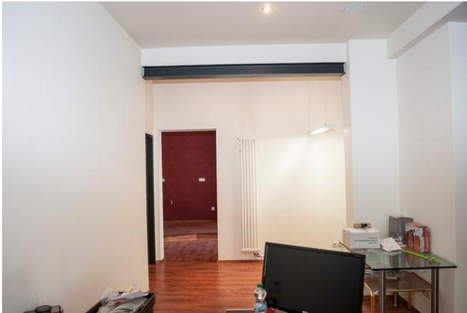
Büro - Ausstellungsraum 1.2