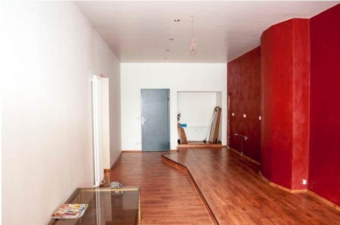
Büro- Ausstellungsraum 1