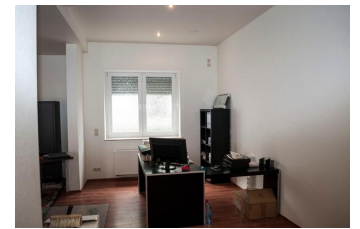
Büro - Ausstellungsraum 1.4