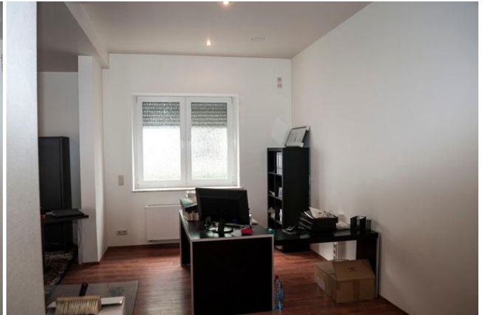
Büro - Ausstellungsraum 1.4