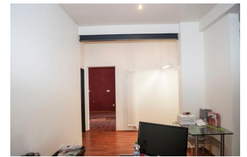
Büro - Ausstellungsraum 1.2