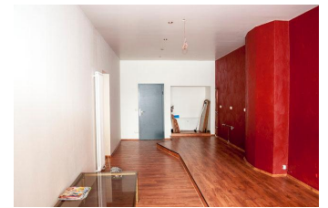
Büro- Ausstellungsraum 1

Nutzungsart Gewerbe Vermarktungsart Miete/Pacht Objektart Einzelhandel