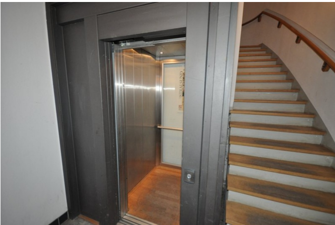
Fahrstuhl u. Hausflur