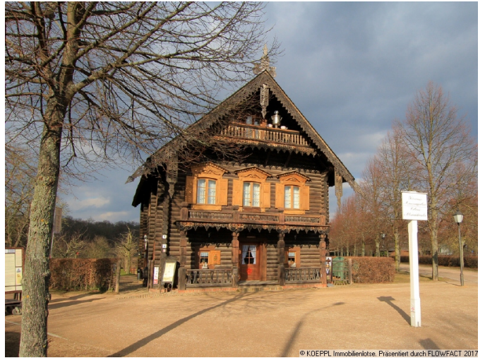
Umgebung Russ Kolonie

© KOEPL Immobilienlotse. Präsentiert durch FLDwFACT 2017