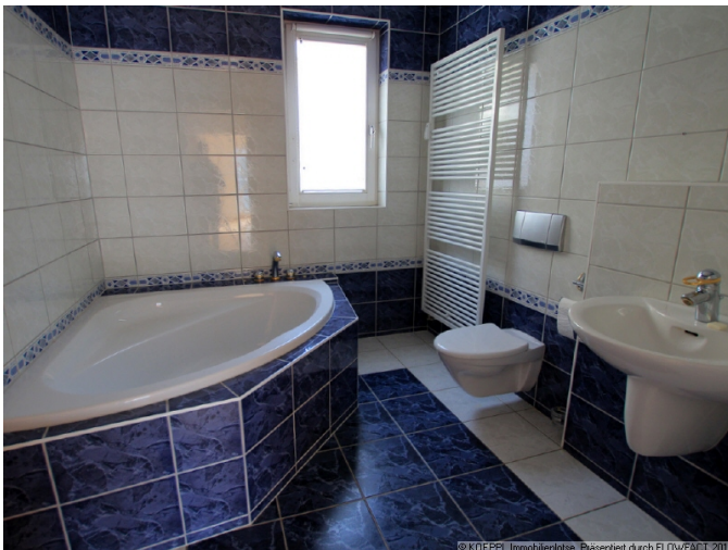
Wannenbad mit Eckwanne