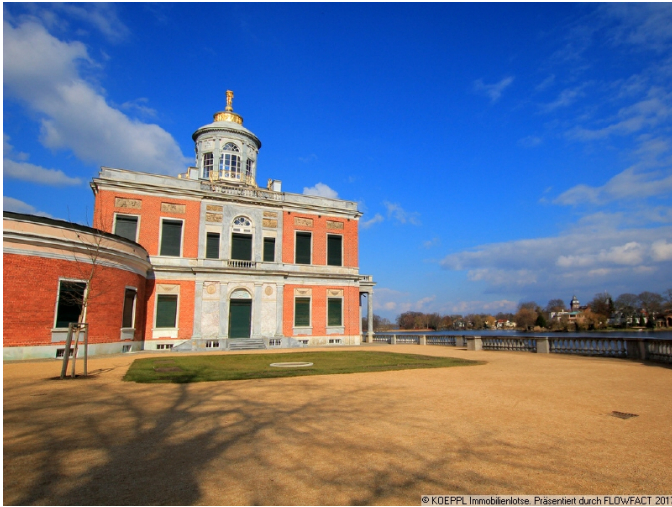
Umgebung Neuer Garten