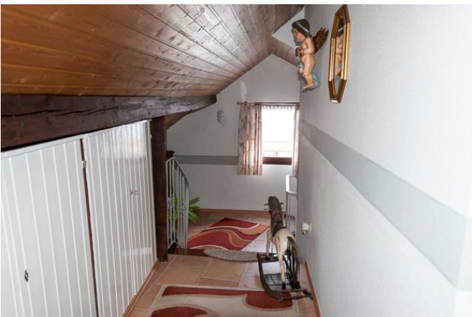
Flur mit Einbauschränken 1.2