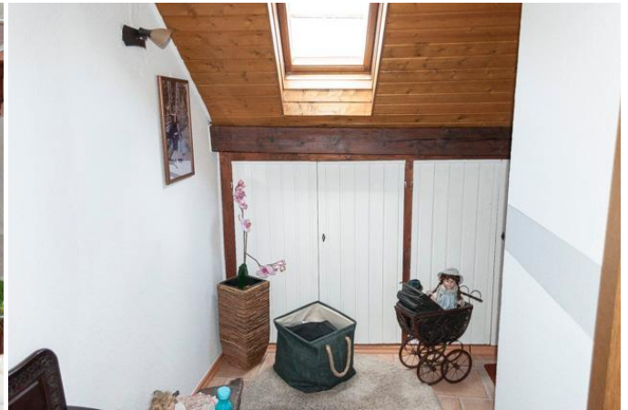
Flur mit Einbauschränken 1.1