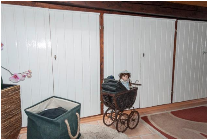
Flur mit Einbauschränken 1