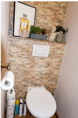
Gäste WC 1