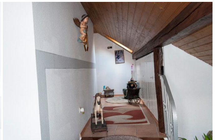
Flur mit Einbauschränken 1.3