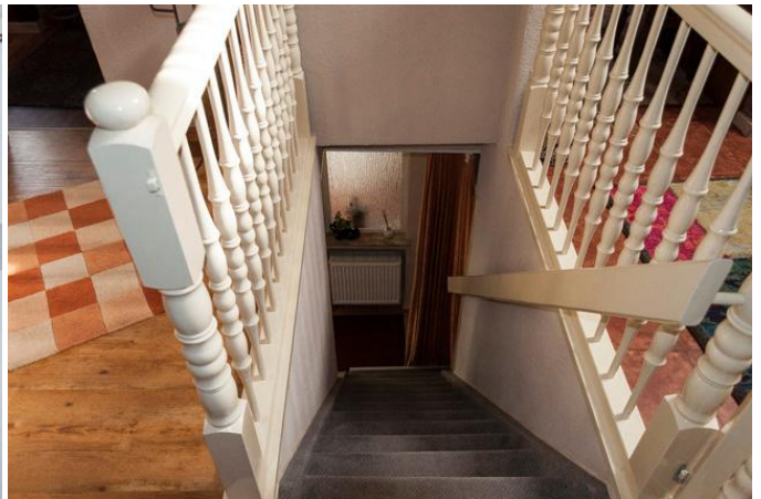
Treppenabgang Empore 1