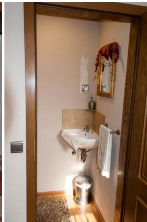
Gäste WC 1.1