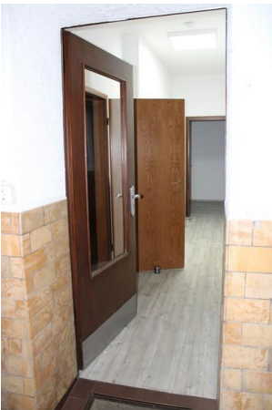
Flur Büro (2)