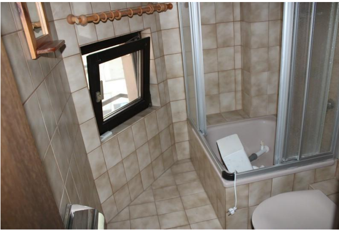
Bad 2 WHG