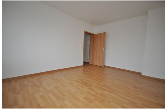
Wohn- u. Schlafzimmer