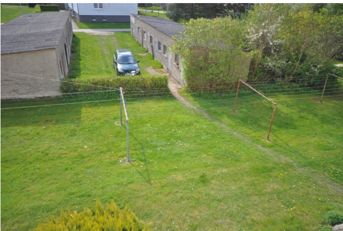
grüner Hof / Wäscheplatz