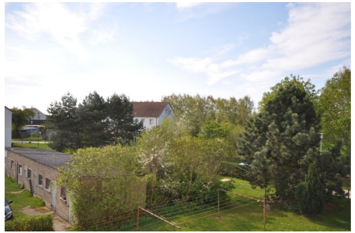
grüner Hof / Wäscheplatz