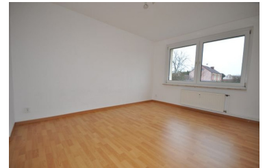
Wohn- u. Schlafzimmer