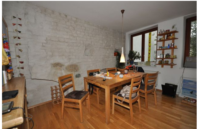
WZ mit offener Küche