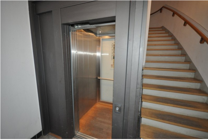
Fahrstuhl u. Hausflur