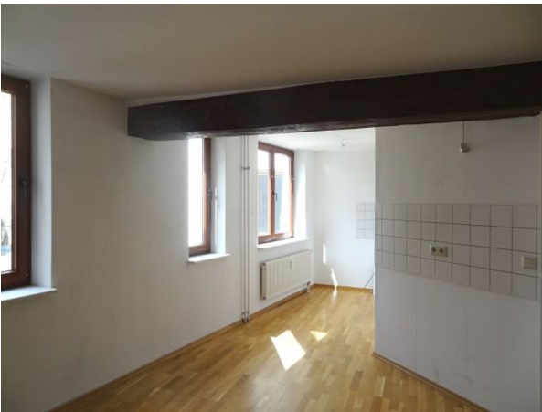
WZ mit offener Küche