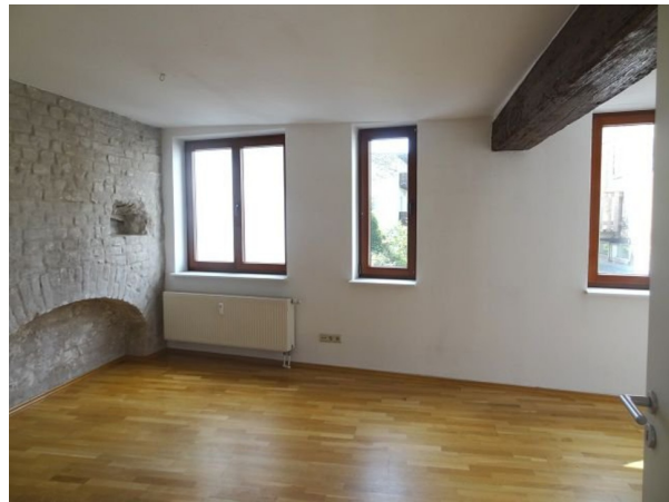
WZ mit offener Küche