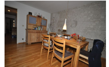
WZ mit offener Kueche

Nutzungsart Wohnen Vermarktungsart Miete/Pacht Objektart Wohnung Objekttyp Etage