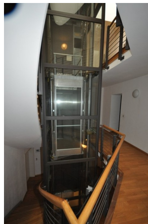
Fahrstuhl u. Hausflur