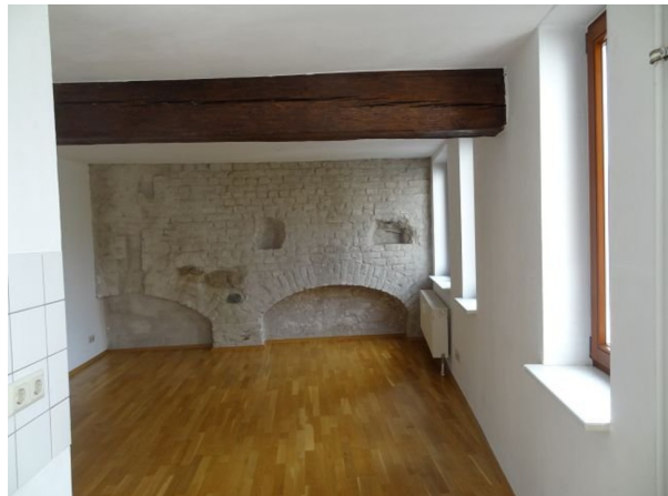
WZ mit offener Küche