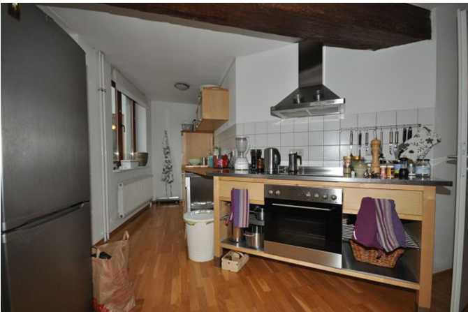
WZ mit offener Küche