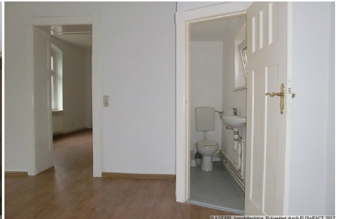
Schlafzimmer mit WC