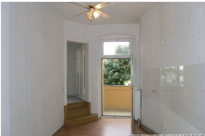
Küche mit Balkon und Nebenraum